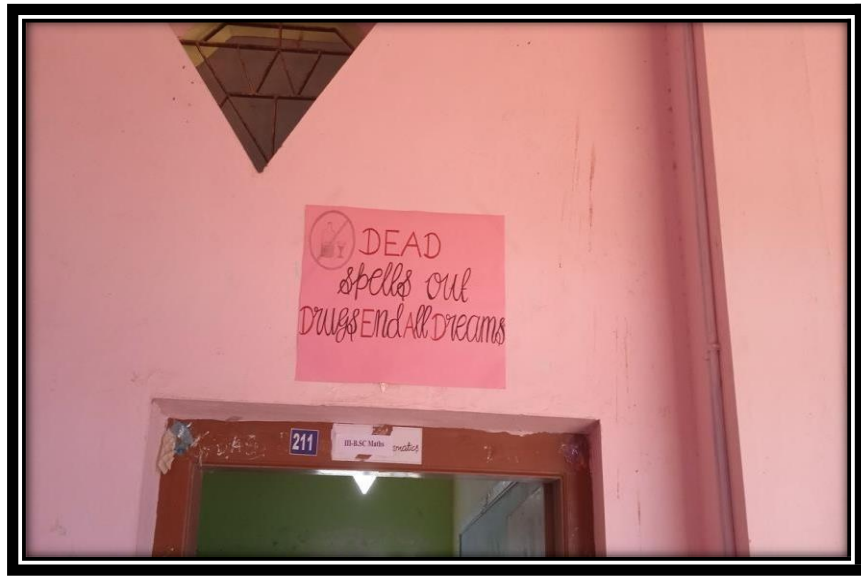
FIGURE 4: Awareness quotes in the College campus