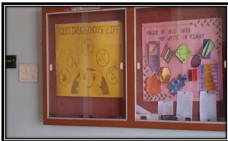
FIGURE 2: Awareness Poster in the College Notice board

Consequences in deciding to use alcohol and other drugs” were displayed throughout the Campus.