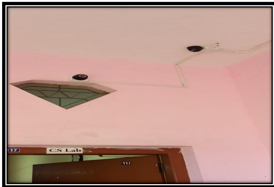
FIGURE 5: CCTV for Secure Students