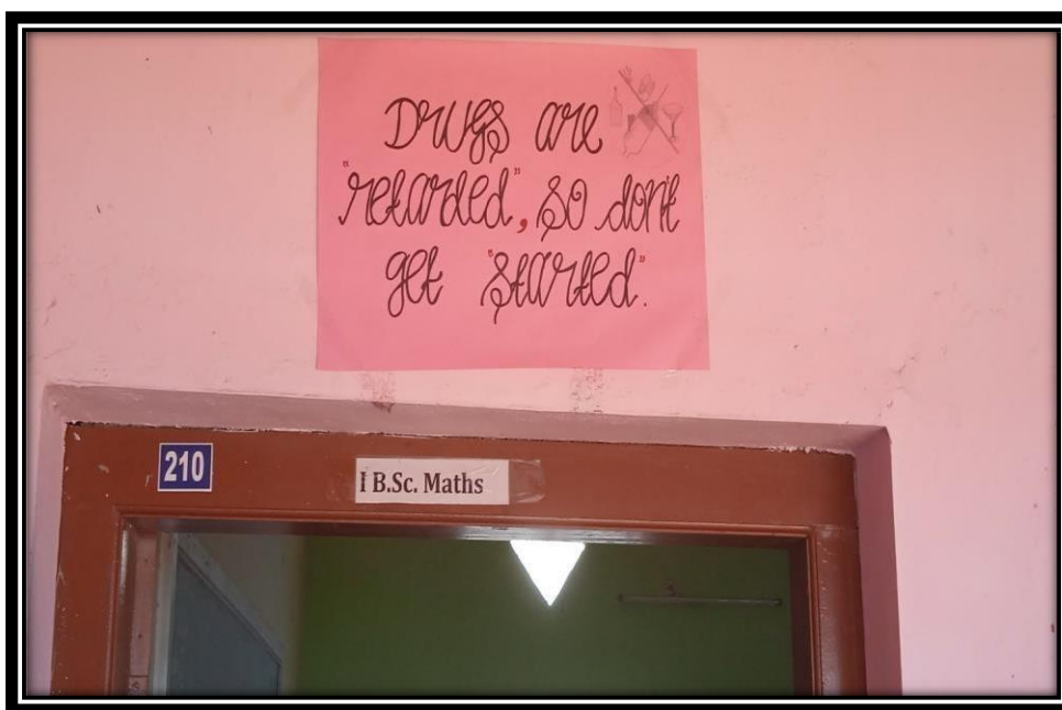
FIGURE 3: Awareness quotes in the College campus