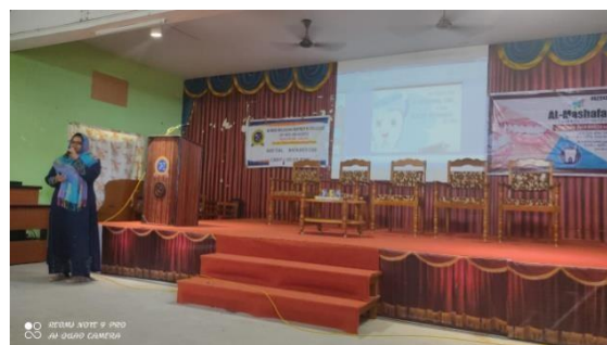
Fig. No 1 Dental Awareness Camp