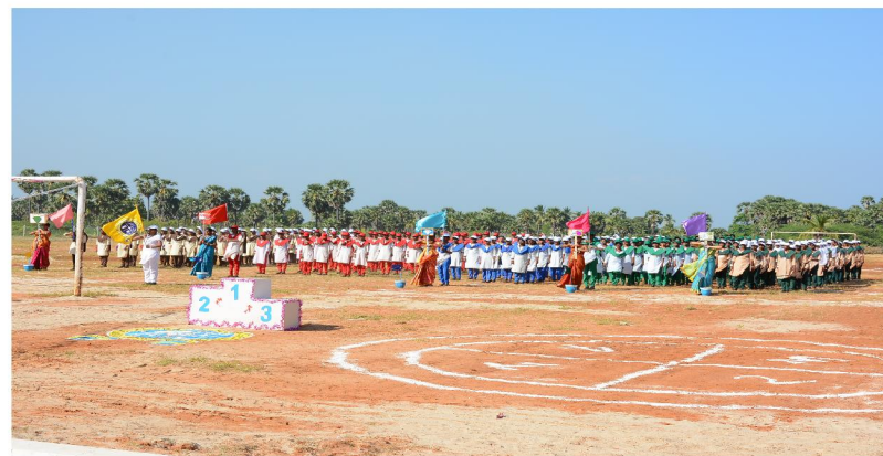
Mini - Olympic Play Ground