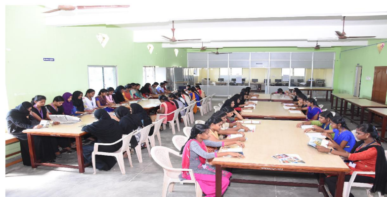
A Treasure House of Information