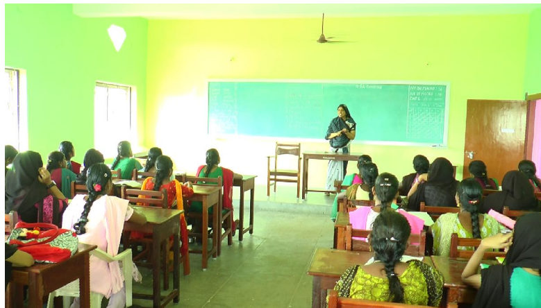
A Live Lecture Hall